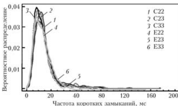
Рис. 1. Вероятностное распределение продолжительности коротких замыканий для шести экспериментов

При оценке продолжительности коротких замыканий для электродов типа С наблюдается большое отклонение (на 8,33 %) по сравнению с электродами типа Е. В случае с периодичностью коротких замыканий наблюдается разница на 9,28 % при сравнении обоих параметров. Большая нестабильность при переносе металла при коротких замыканиях наблюдается при сварке электродами типа С.