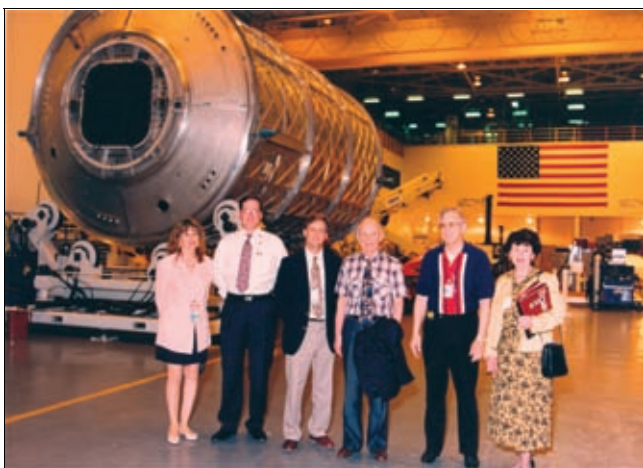
В Исследовательском центре НАСА. США, май 1996 г.