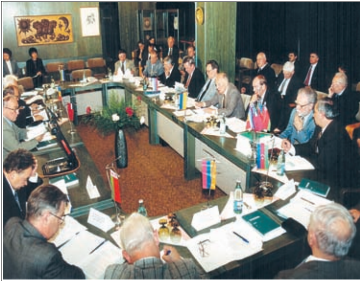
Заседание совета Международной ассоциации академий наук. Дубна, 21 июня 2000 г.