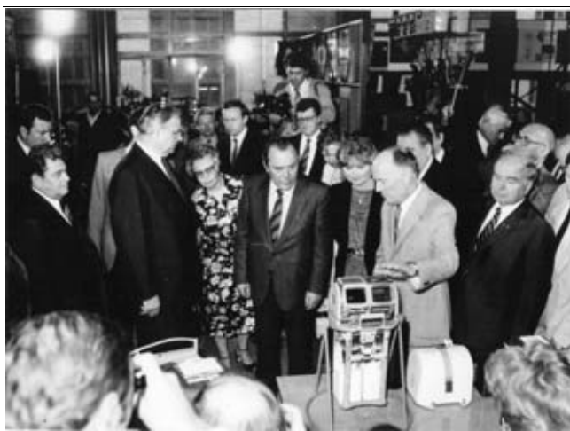
Прием в ИЭС им. Е. О. Патона канцлера ФРГ Гельмута Коля. Киев, июнь 1983 г.

Б. Е. Патон — один из инициаторов создания и сохранения общего научного пространства в рамках СНГ. В 1993 г. была создана