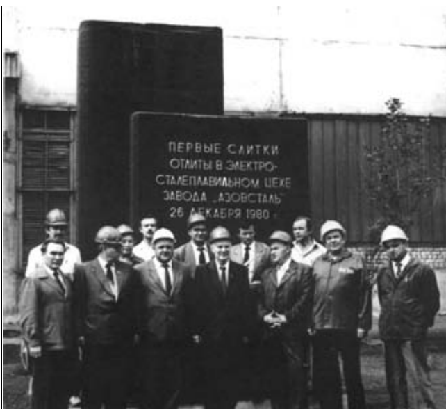
Делегация ИЭС им. Е. О. Патона на заводе «Азовсталь». Мариуполь, 1982 г.

В 1972 г. по инициативе Бориса Евгеньевича создан Международный научно-технический совет стран-членов СЭВ по проблемам сварки. Благодаря деятельности совета, успешно работавшего до 1992 г., многие научные и технические учреждения стран-членов СЭВ вышли на современный уровень исследований и оказали большое влияние на развитие сварки в своих странах.