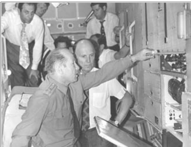
Б. Е. Патон с летчиком-космонавтом А. А. Леоновым в тренировочном комплексе орбитальной станции в Центре подготовки космонавтов им. Ю. А. Гагарина, Звездный городок, Москов. обл., 1973 г.