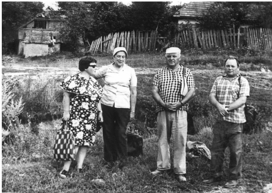
Фото 8. с. Молодове (перед затопленням), 1978 р.