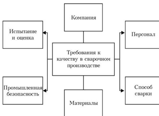
Рис. 1. Система гарантии качества в сварочном производстве

Требования к образованию и квалификации в сварке являются составляющими как национальных, так и международных стандартов (таблица). Так, большинство технических стандартов, одним из которых является стандарт 6200-2 «Сварка железнодорожных вагонов», основывается на существующих международных нормах, описывающих требования к персоналу. Другие способы соединения такие, как например, технология соединения склеиванием, которая является отдельным