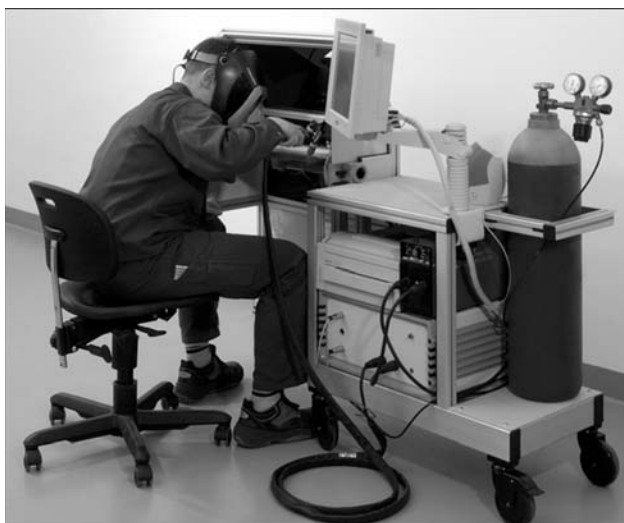
Рис. 3. Обучение навыкам ручной сварки с помощью сварки на сварочном тренажере

В совместном исследовательском проекте с Институтом электросварки им. Е. О. Патона НАН Украины был создан сварочный тренажер (рис. 3), на котором можно отрабатывать основные навыки по дуговой сварке без зажигания дуги высокой мощности. Происходит это следующим образом.